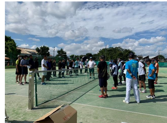
各試合ランク別にご挨拶 一般・シニア①・シニア②・シニア③・④レディース