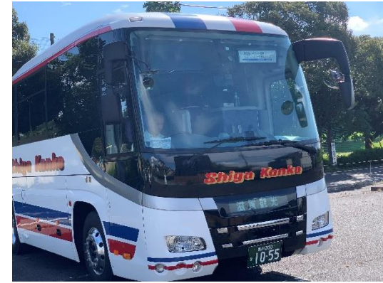
敦賀市様チャーターバスで来場